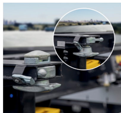
Verzinkte Containerverriegelung mit Verdrehsicherung, versenkbar für das Unterfahren der Wechselbrücken