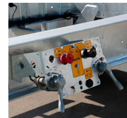
Bedieneinheit für Feststellbremse und Luftfederung mit zwei Hub- und Senkventilen seitlich am Langträger des A.WF (ein Hub- und Senkventil beim Z.WF)