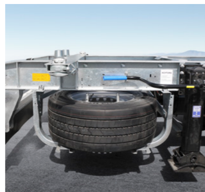
Ersatzradhalter in Korbausführung und Zwei-Seiten-Stützwindwerk am Rahmen hinten, mit Einseitenbedienung rechts, Ausgleichsfuß und zwei Getriebestufen (Z.WF)