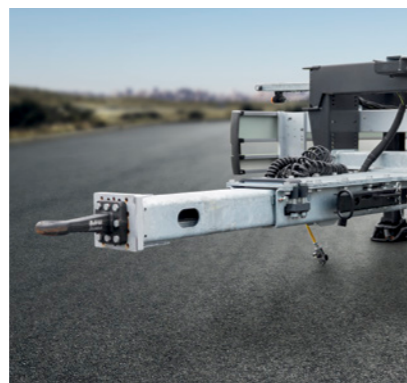
Teleskopierbares Zugrohr* (4x100 mm) mit mechanischer Verriegelung (Z.WF)