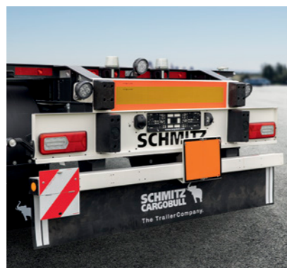
Abgeschrägter Obergurt beim Chassis am Heck vom A.WF, geeignet zur besseren Aufnahme von Wechselbrücken