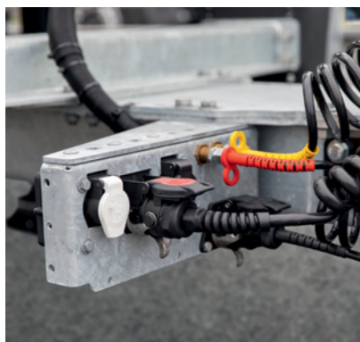
Konsole für Licht- und Brems-Anschluss seitlich am Zugrohr montiert für ein einfaches Handling (Z.WF)