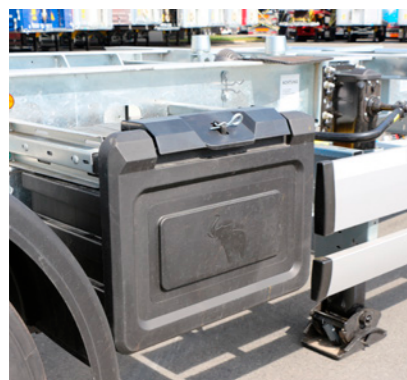
Werkzeugkasten und Dokumentenbox aus Kunststoff hinter Anfahrerschutz