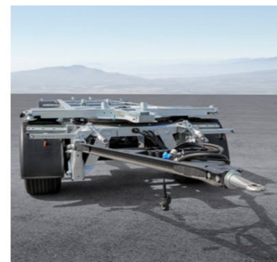
Längenverstellbare Zuggabel* (A.WF)