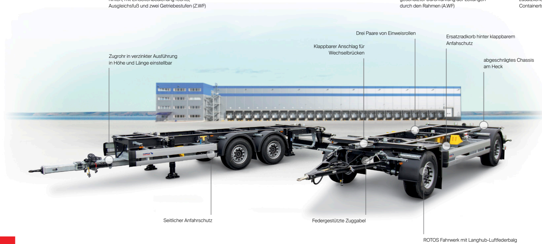
Zugrohr in verzinkter Ausführung in Höhe und Länge einstellbar