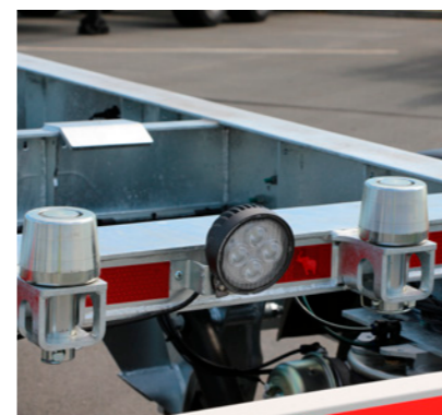
Zwei Paar verzinkte Einweisrollen (optional drei Paar: vorne, mittig und hinten) sowie zusätzliche Arbeitsscheinwerfer* (LED-Ausführung) am vorderen und hinteren Containertragbalken