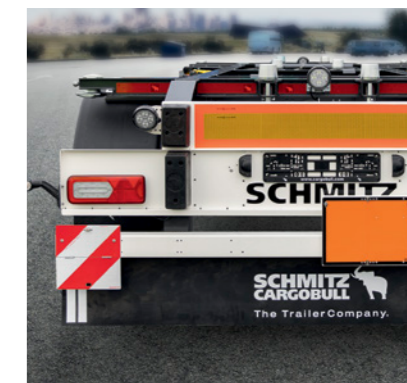
Heckleuchten in LED-Ausführung* zwei Rückfahrscheinwerfer* und zusätzlicher Scheinwerfer* am Containertragbalken, Warntafeln*